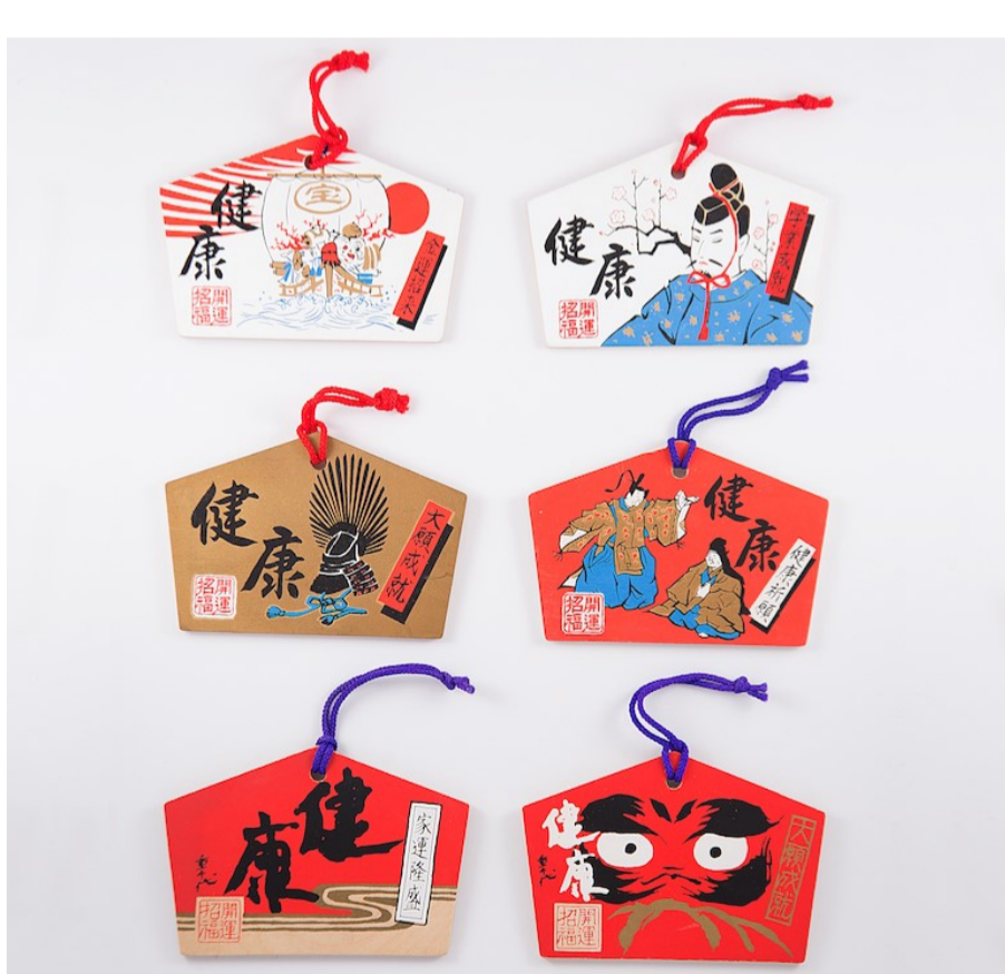
173 - Verschillende ema voor gezondheid en geluk