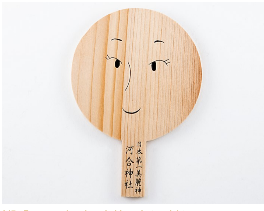
017 - Ema voor de schoonheid van het gezicht