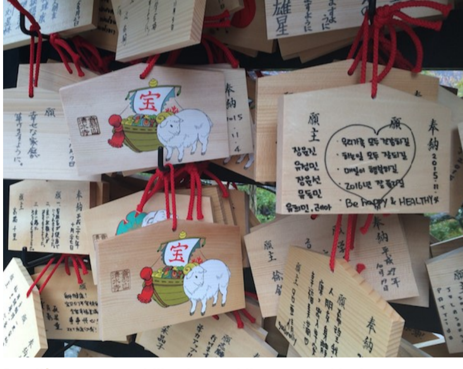
Detailfoto van verschillende ema bij een tempel in Japan

De tentoonstelling is onderdeel van het Leiden Asia Year