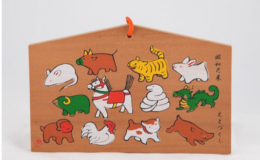
033 - Ema met alle twaalf dieren van de Chinese dierenriem